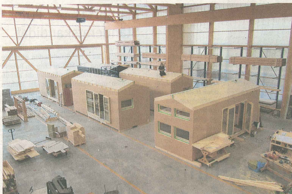
Produktion von Fertigelementen.