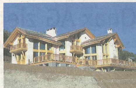
Die Uffer Holz AG ist spezialisiert auf komplizierte Holzkonstruktionen wie z. B. Chesa Corviglia im Engadin.