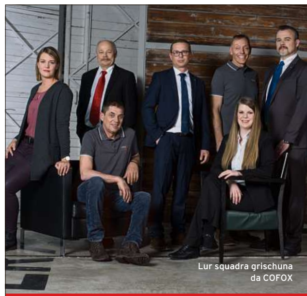
Lur squadra grischuna da COFOX

COFOX Office Bürotechnik für schlaue Füchse