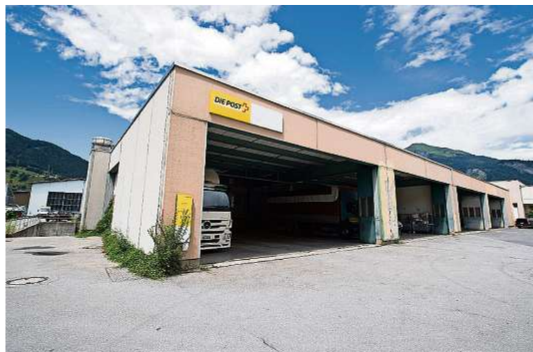
Die Post strukturiert um: Den 72 Mitarbeitenden im Paket-Logistikzentrum in Landquart steht ein Umzug bevor.

kommunizierten Entscheid habe er erhofft, aber auch erwartet. (KE) GRAUBÜNDEN ..... Seite 5